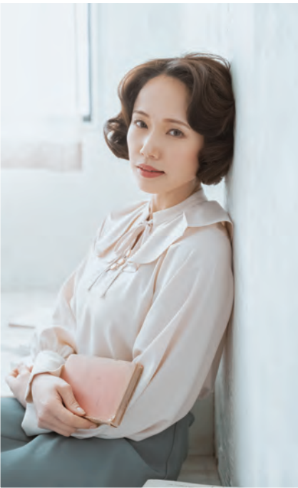
ヒャンアン：ソニン